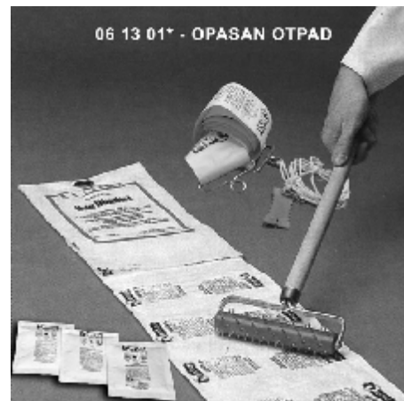
Перфорирање тувек амбалаже

Металним јежом перфориране препарате у тувек апликативној амбалажи треба обесити у проветрен простор, као што је жичани кавез, преко затегнутих жица, а врећице распоредити преко мрежастих жичаних етажа. Ове препарате држати у кавезу док не ослободе сав гас. Препарати из којих је делимично ослобођен гас, могу се раширити и по земљи на осигураном отвореном простору, удаљеном од настањених грађевина, да их деактивира атмосферска влага. Препарати који нису били изложени минимално време (72 – 336 h) да би се гас ослободио (наведено у упутству за употребу) не смеју се покривати са песком. Ако нисте сигурни да ли су препарати изреаговали, контактирајте произвођача Detia Degesch GmbH или дистрибутера.