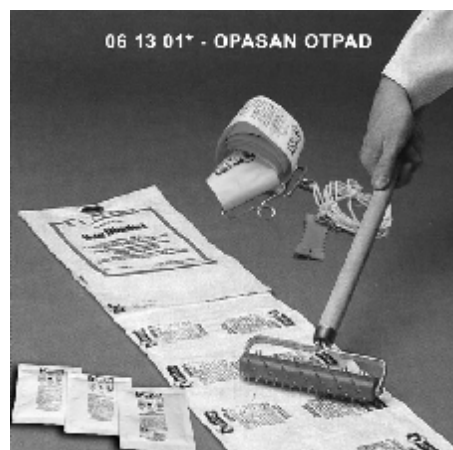
Перфорирање тувек амбалаже

Металним јежом перфориране препарате у тувек апликативној амбалажи треба обесити у проветрен простор, као што је жичани кавез, преко затегнутих жица, а врећице распоредити преко мрежастих жичаних етажа. Ове препарате држати у кавезу док не ослободе сав гас. Препарати из којих је делимично ослобођен гас, могу се раширити и по земљи на осигураном отвореном простору, удаљеном од настањених грађевина, да их деактивира атмосферска влага. Препарати који нису били изложени минимално време (72 – 336 h) да би се гас ослободио (наведено у упутству за употребу) не смеју се покривати са песком. Ако нисте сигурни да ли су препарати изреаговали, контактирајте произвођача Detia Degesch GmbH или дистрибутера.